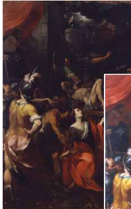
Carlo Francesco Nuvolone, Martirio dei Santi Vito e Modesto. In alto prima del restauro, a destra dopo il restauro.

Stanno inoltre per iniziare i restauri di un importante nucleo di dipinti di artisti lombardi del Sei e del Settecento provenienti dalla Basilica di San Vittore a Varese, tra i quali spiccano tre bellissime tele di Magatti.