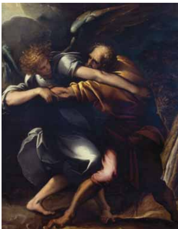
Morazzone, Lotta di Giacobbe con l'Angelo.